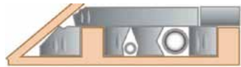
Bjálving við máttum rundan um rør